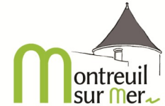
Ville de Montreuil- sur-Mer