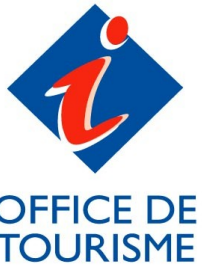
Office de Tourisme de Montreuil-sur-Mer