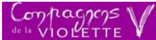
Les Compagnons de la Violette