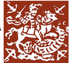
Les Amis des Musées