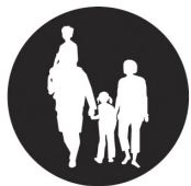
Label Famille Plus