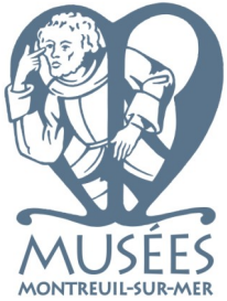
Musée Roger Rodière