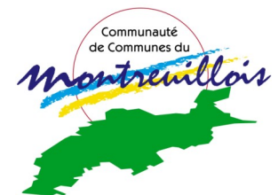
Communauté de Communes du Montreuillois 16